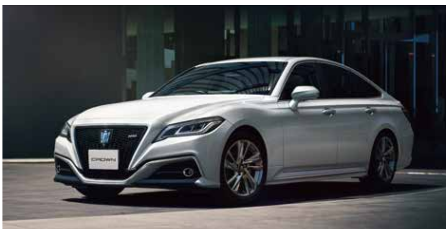
Photo:RS(2.5Lハイブリッド車)、ボディカラーのプレシャスホワイトパール<090>は55,000円(消費税10%込み)、225/45R18タイヤ&18x8Jアルミホイール(スパークリング塗装/RS仕様専用) & センターオーナメントは66,000円(消費税10%込み)でメーカーオプション。■写真は合成です。