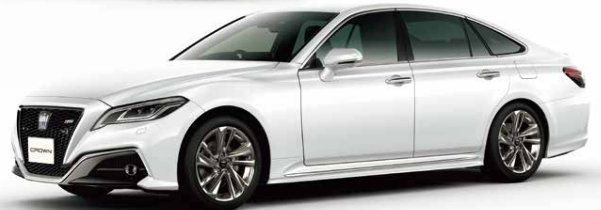
Photo:RS Advance(2.5Lハイブリッド車)、ボディカラーのプレシャスホワイトパール(090)は55,000円(消費税10%込み)でメーカーオプション。■写真は合成です。