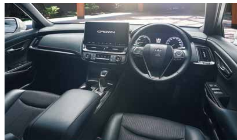
Photo:RS(2.5Lハイブリッド車)、内装色のブラック(レッドステッチ)は設定時に指定が必要で、指定がない場合はブラック(シルバーステッチ)になります。■写真は機能説明のために各ランプを点灯したものです。実際の走行状態を示すものではありません。■写真はハメ込み合成です。