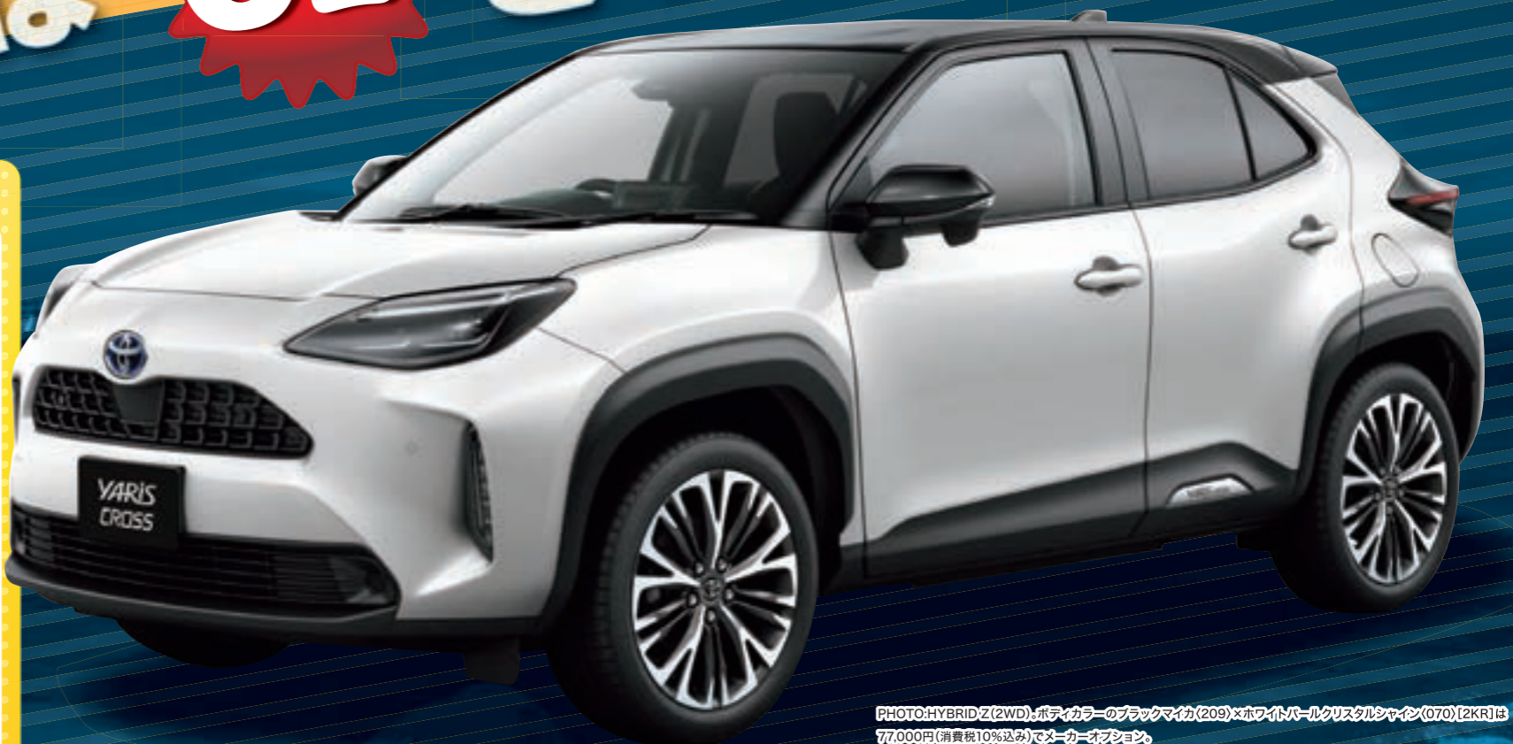
PHOTO:HYBRID Z(2WD)・ボディカラーのブラックマイカ(209)×ホワイトパールクリスタルシャイン(070)(2KR)は77,000円(消費税10%込み)でメーカーオプション

※法人・リース・県外代行納入は対象外となります。※販売店用品合計額が購入サポート合計額を下回っている場合は対象外となります。※他の特典との併用はできません。詳しくはスタッフにおたずねください。対象期間:2020年11月30日(月)まで